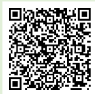
「ラーケーションの日」ポータルサイト

「ラーケーションの日」には、様々な活動ができます。どのような活動ができるのか、どうやって「ラーケーションの日」を取ればよいのかなど、興味をもった人は、おうちの方に配った「保護者用リーフレット」を見たり、右の二次元コードから、「ラーケーションポータルサイト」を見たりしながら、おうちの方と話し合ってください。